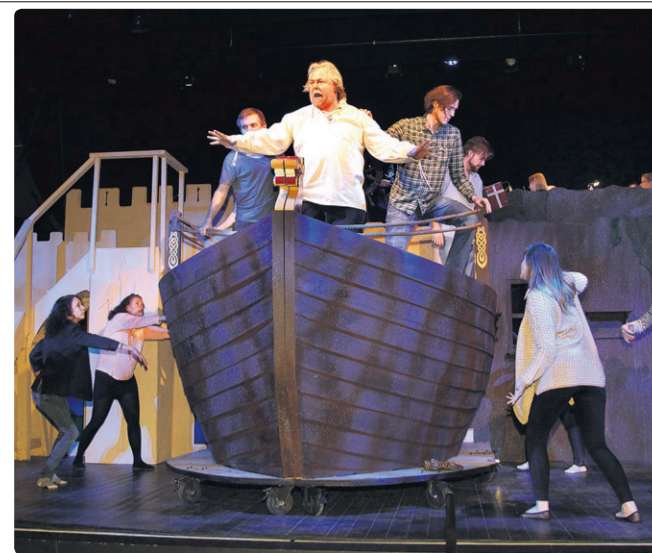
Der er fart på handlingen fra første sekund orkesteret sætter i, når Musicalscenen opfører eventyret "Atlantis".